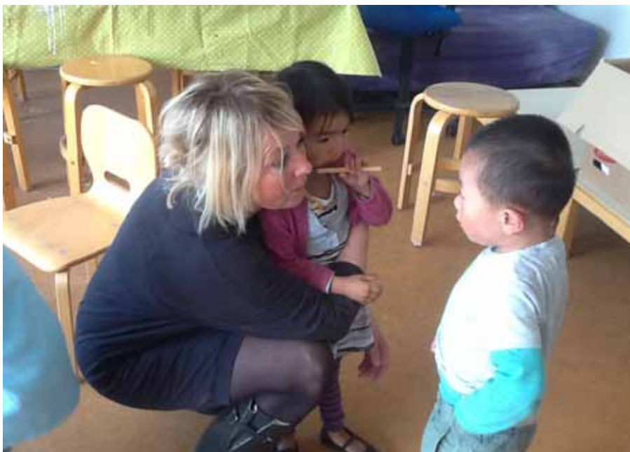
Glimt fra Børnegårdens multietniske hverdag fuld af leg og nærvær. Ved sommerfesterne medbringer hver familie en lille ret og tilsammen opstår en international buffet.

Der skal løbende være plads til nye opdagelser og (selv)erkendelser - også i institutioner med mange år bag sig. Børnegården er blevet bekræftet i deres selvforståelse, og har fået sat fokus på det socialpædagogiske arbejdes betydning. Det at få det synliggjort og at få sat ord på, har givet den faglige stolthed et