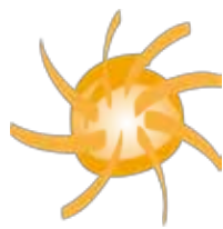
Frie Børnehaver og fritidshjem

4 prakisfortællinger om stærkt samarbejde i Københavns kommune