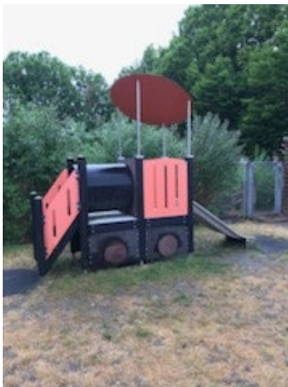
Solen har svisset alt græsset af på bakken 😞