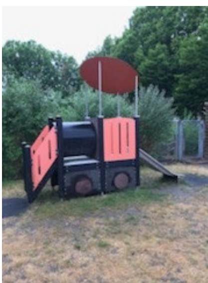
Solen har svitset alt græsset af på bakken 😞