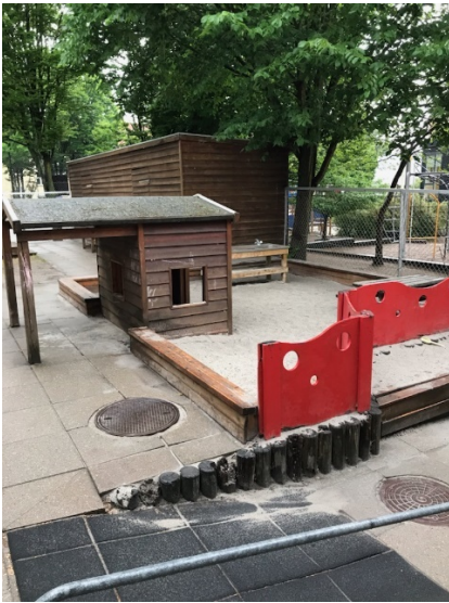
Billedet er taget en regnvejrs morgen