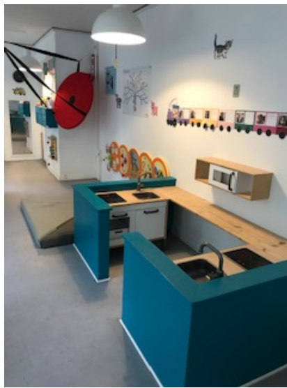
Et lille, hyggeligt hjørne af en af vores stuer