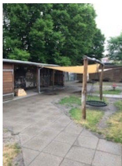
Håber vandet gør græsset grønt igen